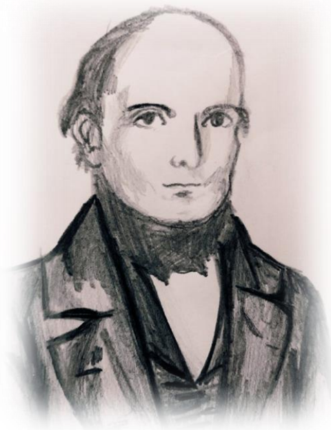
Ritratto di Adolf Andersenn

Al torneo parteciparono i giocatori europei più forti, britannici, tedeschi, francesi, ungheresi e russi entusiasti anche per il montepremi che si riuscì a mettere a disposizione di 500 sterline. Presidente del Torneo fu il Duca di Marlborough che assieme a Staunton e altri colleghi, aveva anche l'ambizione di istituire il "Parlamento degli scacchi" che avrebbe dovuto regolamentarne il gioco, standardizzandolo.